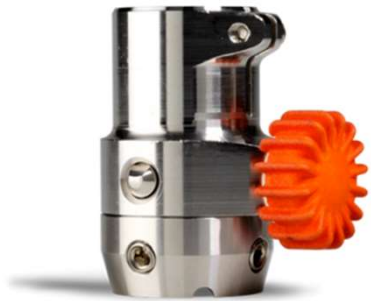
Position fermée et verrouillée