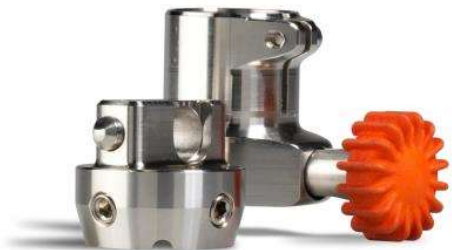
Position ouverte et déverrouillée